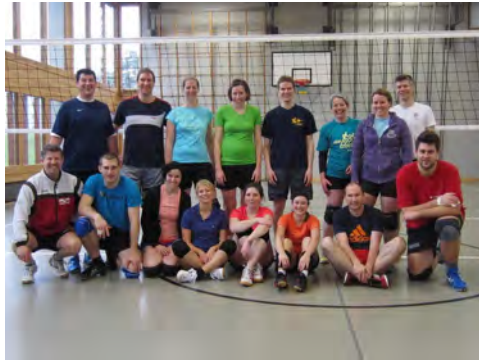
Bilder vom Volleyballtrainingstag