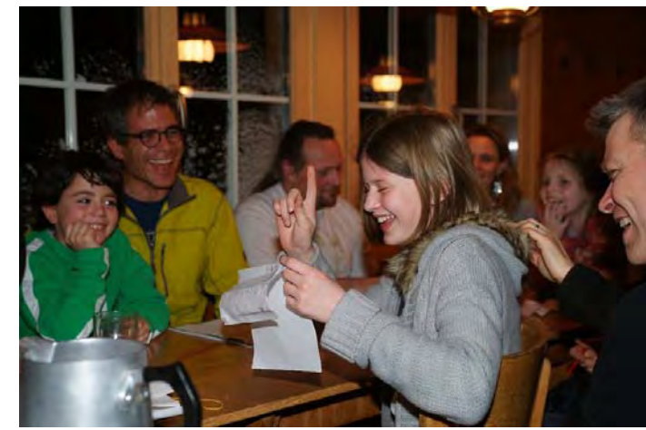
...und macht gute Laune