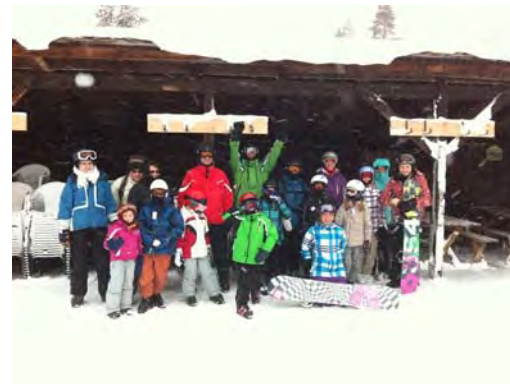
Ein Teil unserer Gruppe

Vier Familien haben vom 06. bis 08. Januar etwas Leben in die Skihütte auf der Wolzenalp gebracht. Schnee hatte es recht viel, es war fast zu warm, aber zum Glück schneite es und regnete nicht.