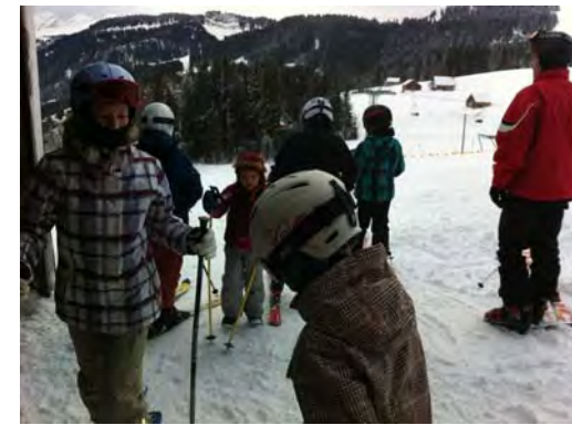
Achtung, fertig, los, ab auf die Piste