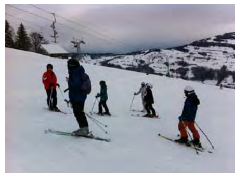
Piste gut, Wetter mässig

Vier Familien haben vom 06. bis 08. Januar etwas Leben in die Skihütte auf der Wolzenalp gebracht. Schnee hatte es recht viel, es war fast zu warm, aber zum Glück schneite es und regnete nicht.