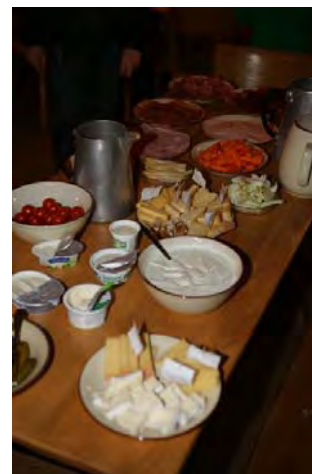
Skifahren gibt Hunger...