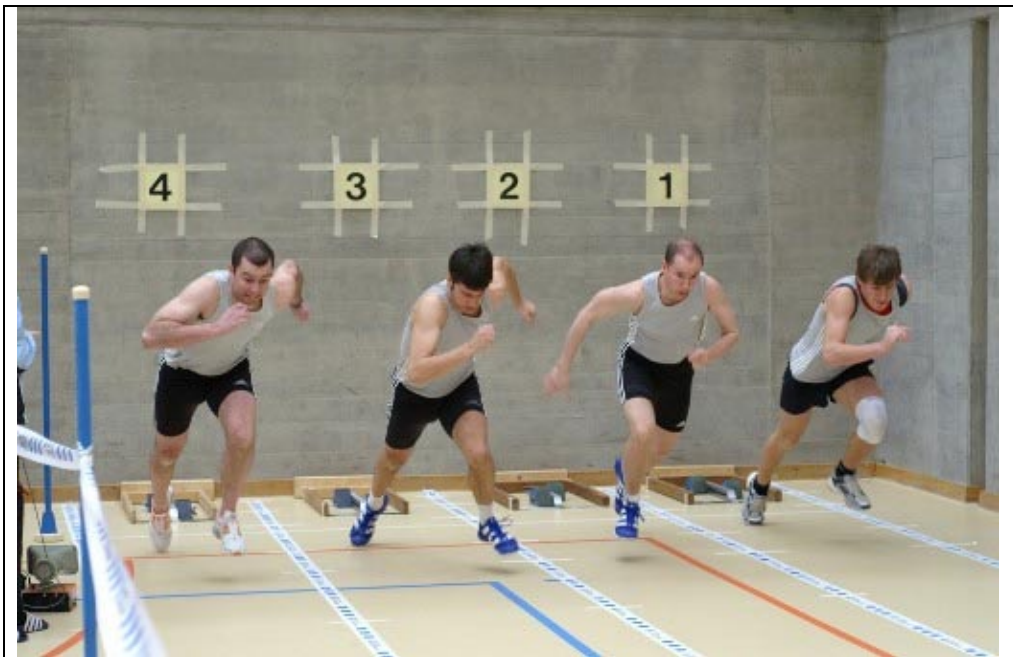
Start der Männer zum 30-Meter Sprint

Fünf verschiedene Disziplinen wurden auch dieses Jahr am Hallencup in Effretikon für die LA-Mannschaften angeboten. Nämlich 5 kg (Frauen 4 kg.), Kugelstossen, 30 Meter Sprint, Dreihupf, Hochsprung und der Pendellauf. In sämtlichen Disziplinen gelang es der NS sowohl eine Frauen- wie auch eine Männerequipe zu stellen, und dies erst noch mit beachtlichem Erfolg. Den Frauen gelang der Sprung auf das Podest im Sprint (3. Platz) und im Hochsprung (2. Platz). Den Männern lief es noch besser, sie standen in drei von fünf Einsätzen auf dem Podest. Nämlich im Hochsprung wo sie mit einer geschlossenen Mannschaftsleistung sogar den Sieg erspringen konnten, im Sprint (3. Platz) und im Kugelstossen (3. Platz). Einzig im Pendellauf schafften es weder die NS-Frauen- noch die NS-Männer ohne Übergabefehler ins Ziel zu kommen, was einen Podestplatz verunmöglichte. Glück und Pech in der Pendelstafette liegen nahe beieinander. Mit den erbrachten Leistungen darf durchaus mit einigen Hoffnungen in die kommende LA-Saison geblickt werden.