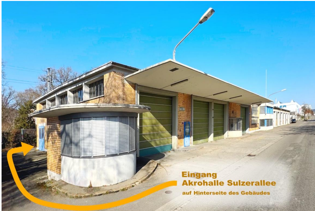
Akrohalle Sulzerallee: Ansicht von vorne

Der Eingang der Akrohalle Sulzerallee befindet sich hinter dem Gebäude Sulzerallee 1/3. Der Weg führt links am Portierhäuschen vorbei auf die Rückseite zum Eingang.