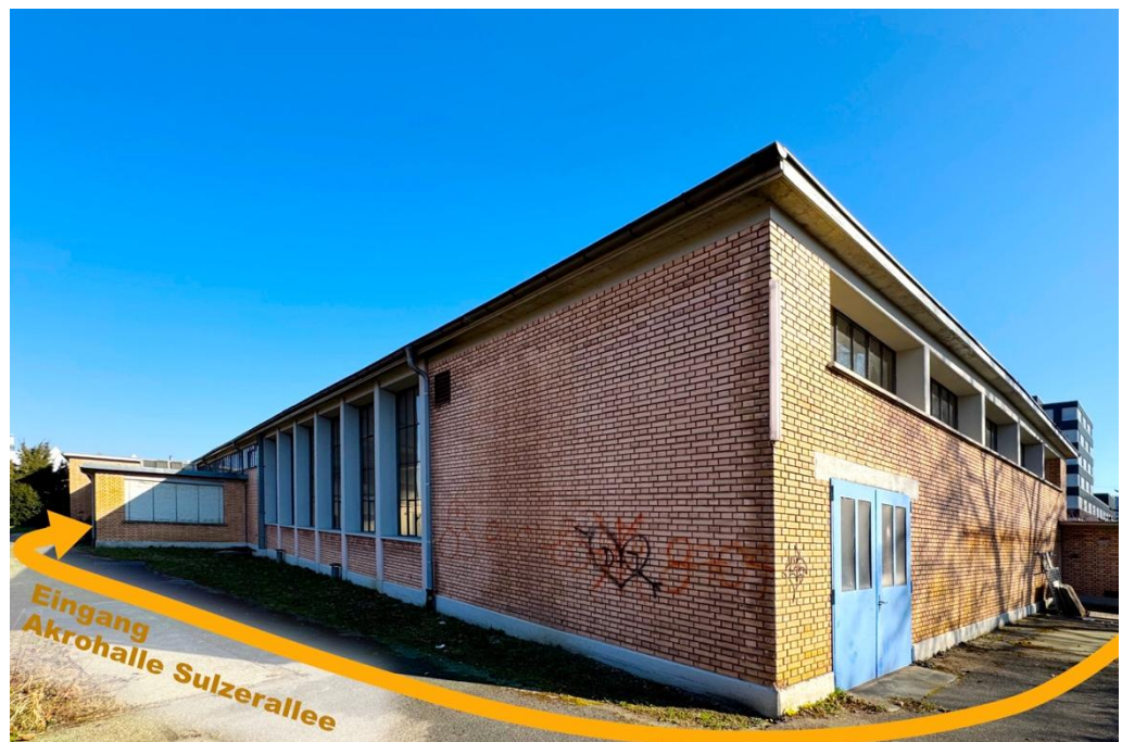
Akrohalle Sulzerallee: Ansicht von hinten