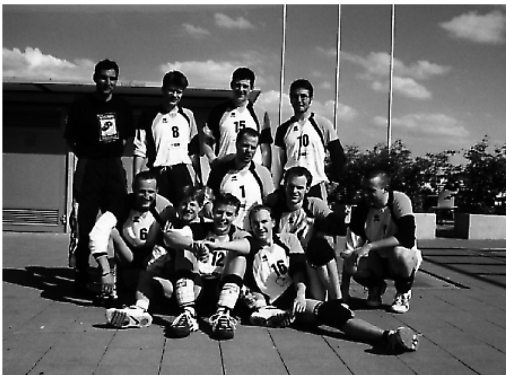
1. Herren-Mannschaft am Kantonalmeisterturnier, 1999

Parallel zum Kreisturnverband entwickelte sich die Kantonalliga. Diese fasst die besten Mannschaften der fünf Kreisturnverbände Winterthur (KTVW), Glatt- und Limmattal (GLTV), Zürichsee-Oberland (TVZO), Turnverband am Albis (TVaA) und Turnverband der Stadt Zürich (TVSZ) zusammen. Im Jahre 1987 erkämpfte sich unsere 1. Mannschaft einen Platz in der erwähnten Kantonalliga. Die nächsten zwei Jahren musste die Neue Sektion allerdings wieder in der 2. Liga spielen. Der Aufstieg glückte danach mit einer neuen Mannschaft erneut. Unterdessen ist es bereits sechsmal gelungen, nämlich in den Jahren 89, 94, 95, 97, 98 und 99, den Titel des kantonalen Meisters des STV nach Winterthur ins Gutschick zu holen. Damit ist die Neue Sektion Rekordmeister im Kanton. Keine andere Mannschaft durfte diesen Titel bis jetzt so oft für sich in Anspruch nehmen. Eine tolle Leistung!