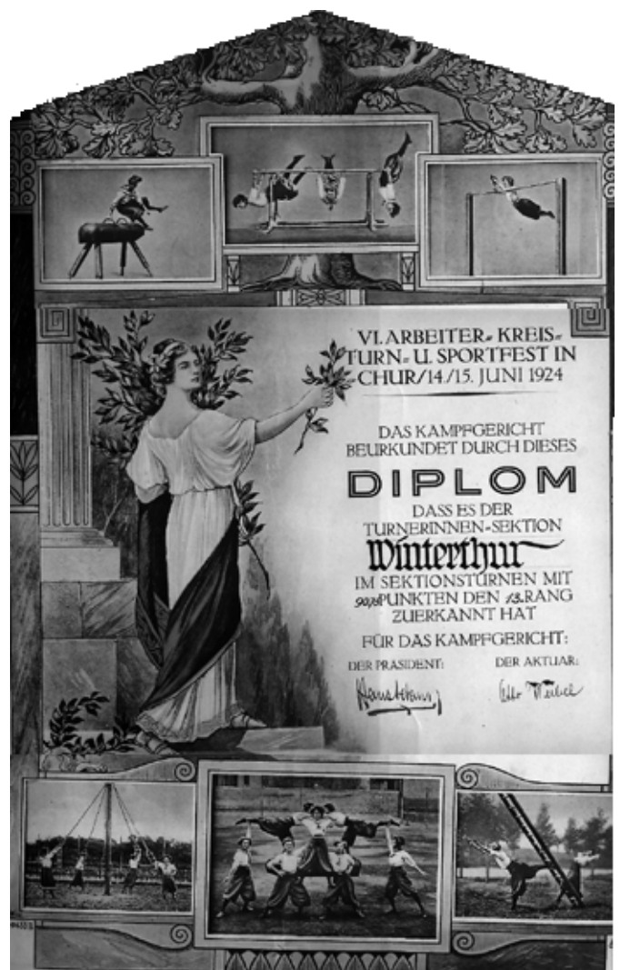
Diplom der Turnerinnen, 1924

Sicherlich sprach man in dieser Zeit mit Hochachtung von den Erfolgen unseres Vereines. Dass die Erfolge nicht nur zufällig zustande kamen, zeigt deren Regelmässigkeit. Es wurde tatsächlich hart dafür trainiert, hart dafür «gearbeitet», wie man damals zu sagen pflegte.